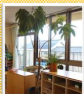
保育室のパキラもすくすく育っています

「土が乾いたらたっぷりのお水を」とよく言いますが、タイミング分かりますか？これらの観葉植物はお水が足りなくなると少し「シュン」となります。その後たっぷりのお水をあげると次の日には復活！すごいです！