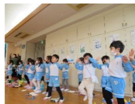
穿こう、穿こう、鬼～のパンツ～♪