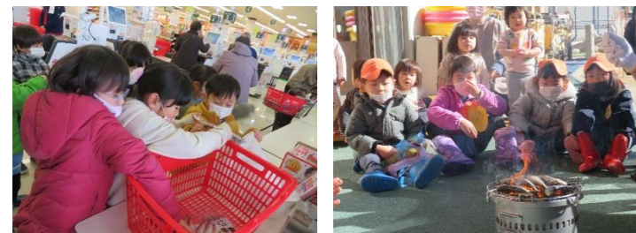
いわしを買いに行って、焼いたよ。