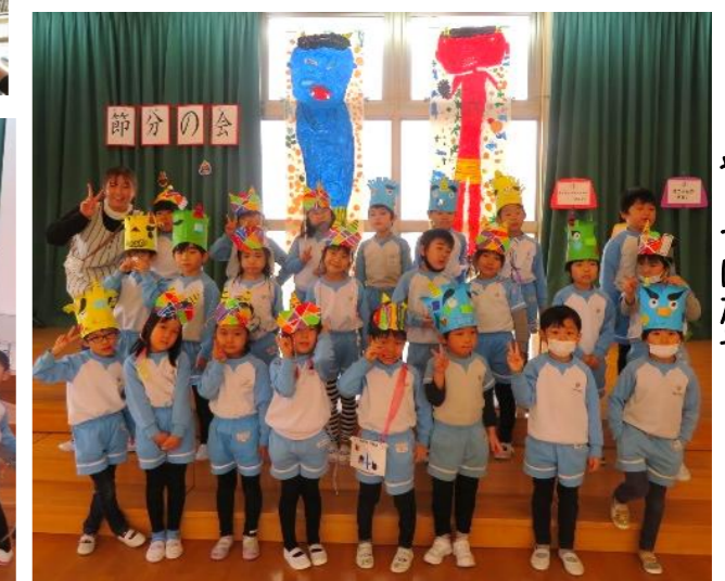
みんなで、お腹の鬼も 本物の鬼も やっつけたぞー！！