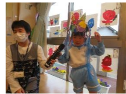
こんなお面作ったよ♪