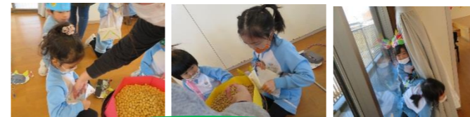
炒り豆で、やっつけるぞー！