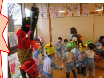
うわあああ～！！ 後ろからも来た～！！